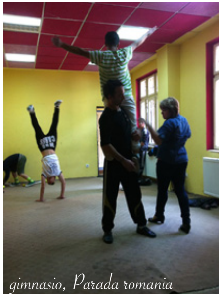
gimnasio, Parada rumania