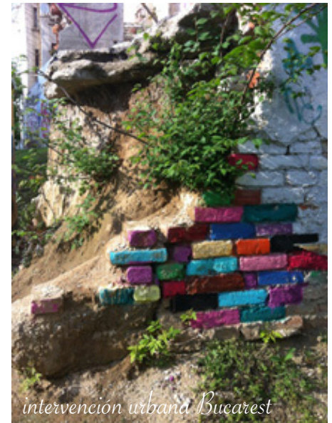
intervención urbana Bucarest