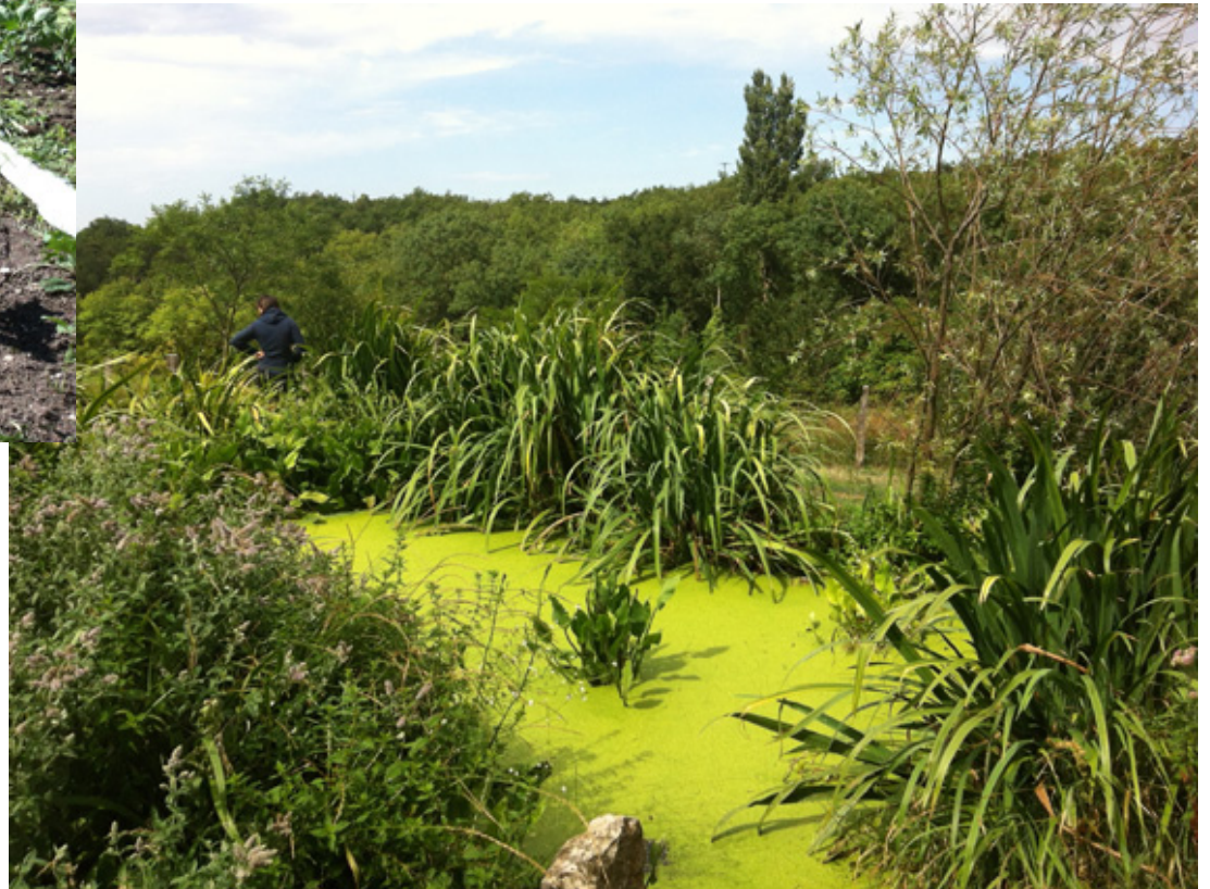
Phyto-epuracion ( http://fr.wikipedia.org/wiki/Phyto%C3%A9puration )