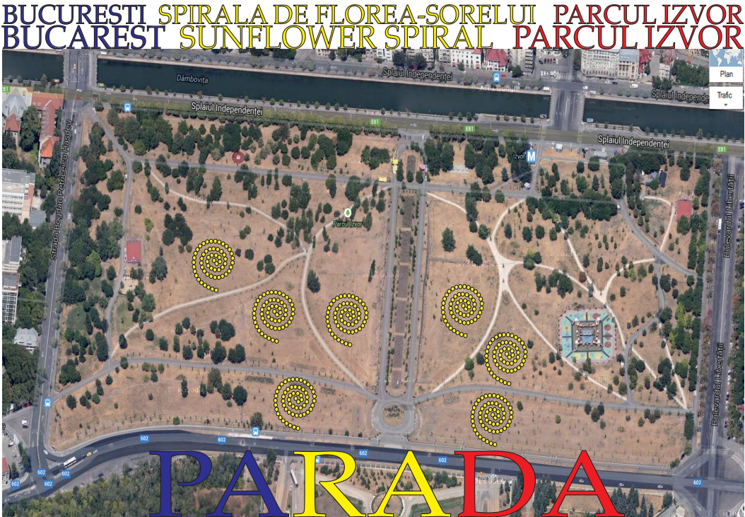
vista más detallada de las posibles ubicaciones