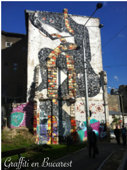
Graffiti en Bucarest