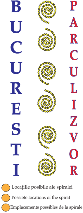
Localización Global con varias posibles ubicaciones