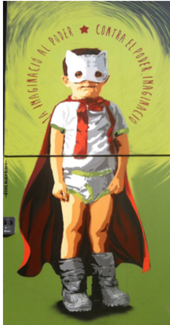
Pra communitari Roquetes Hort communitari Roquetes