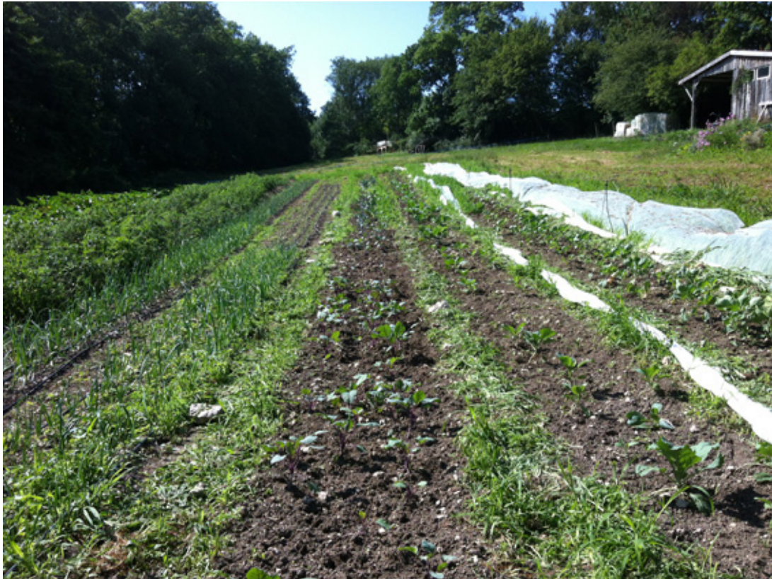
Permacultura ( http://fr.wikipedia.org/wiki/Permaculture )

Después de una noche en el festival «Paleo», fui a descubrir otro lugar nacido del encuentro de Pierre Rahbi ( https://www.youtube.com/watch?v=cUmtPOOtPck&spfreload=10 ) y Michel Valentin, Les Amanins ( http://www.lesamanins.com ), una granja y escuela, autosuficiente y ecológica en la Drôme. Pasé sólo 3 días, pero fue maravilloso, tanto en humano y en el aprendizaje destilados. Yo pensaba ya en volver a seguir una formación allí.